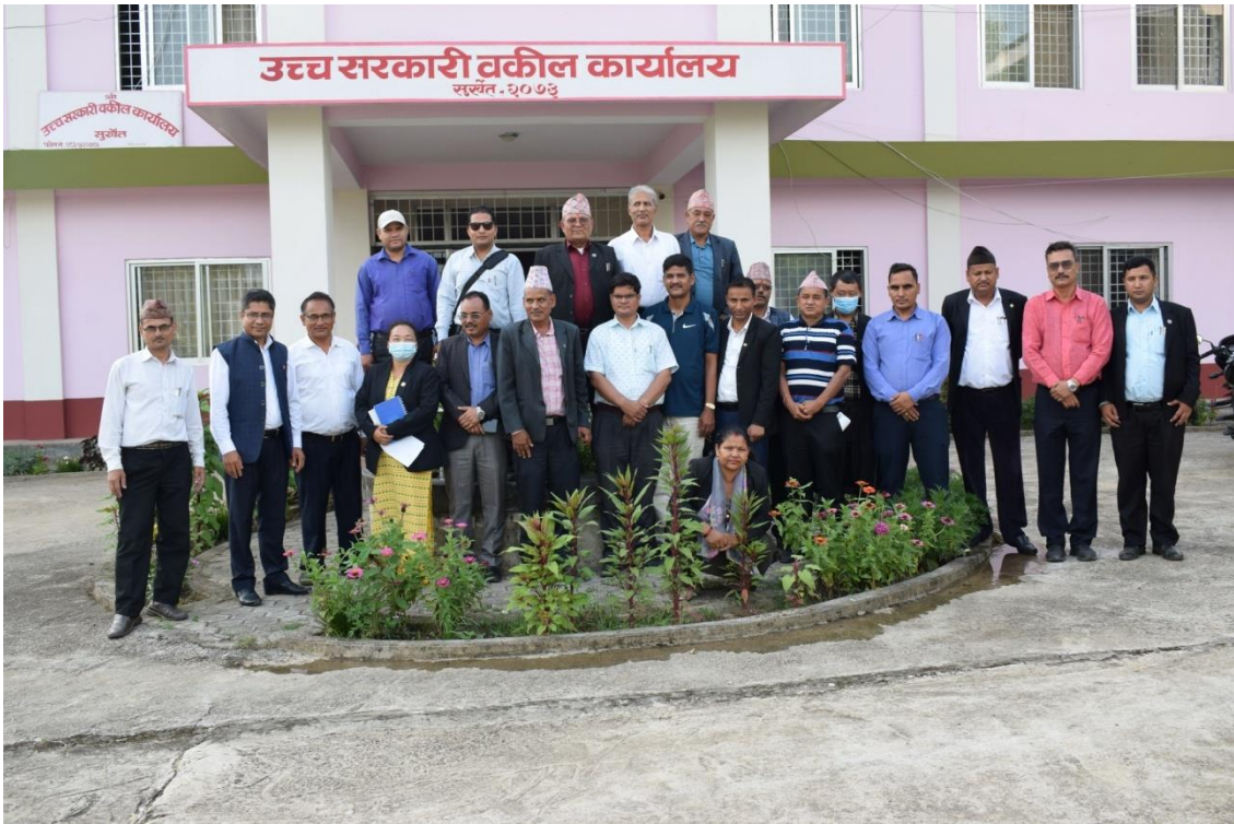
कार्यक्रमका सहभागी सरकारी वकील र कानून व्यवसायीहरु ।