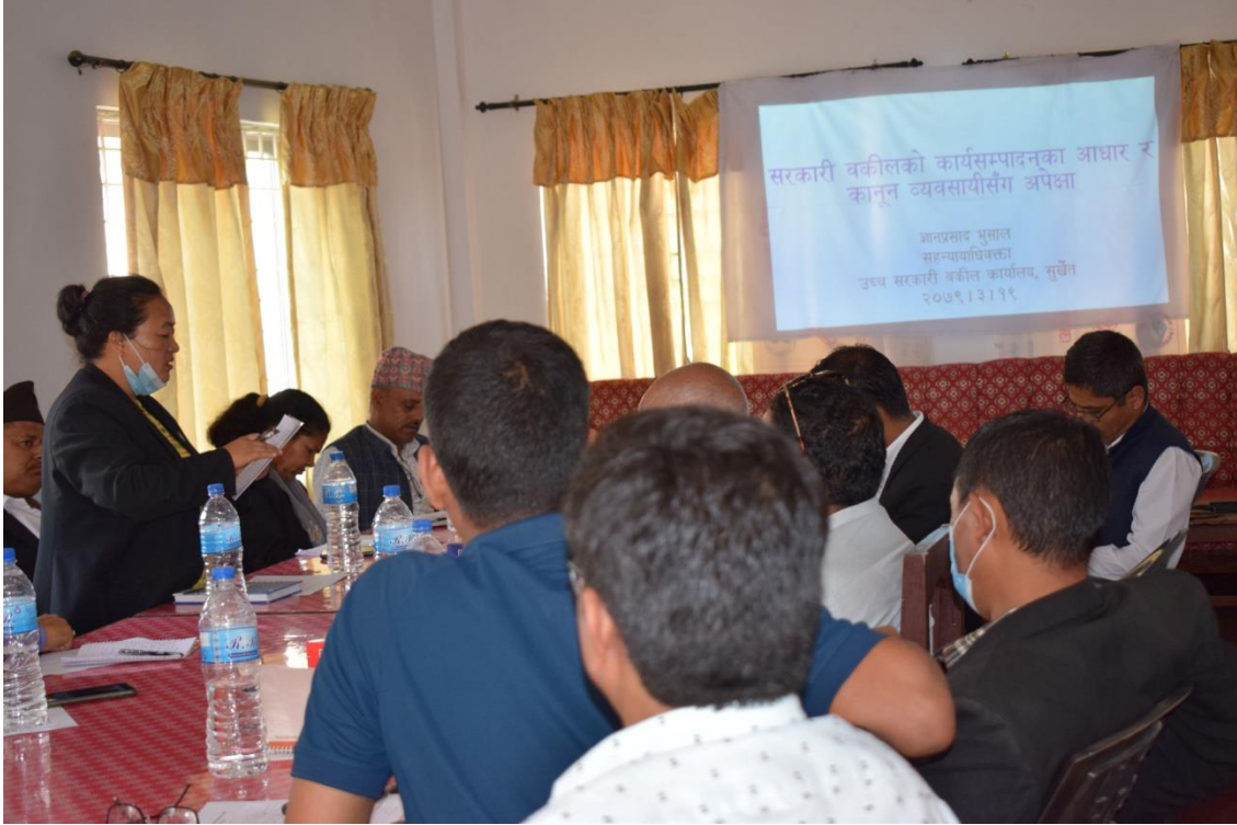
अन्तरक्रिया कार्यक्रममा धारणा राख्दै कानुनी व्यवसायी ।